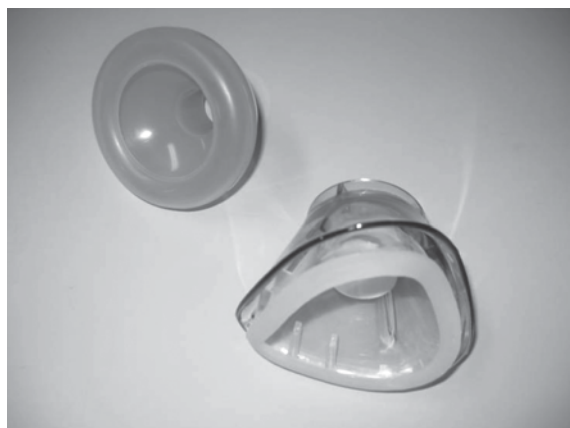
Figuur 1: Enkelmasker (links) en dubbelmasker (rechts).

Bij inleiding via de kap kan gebruik gemaakt worden van een enkelmasker of dubbelmasker (figuur 1) dat op het gelaat geplaatst wordt. Op een dubbelmasker is randafzuiging aangebracht, zodat emissies direct bij de bron worden afgezogen. Tijdens de inleiding doseert de anesthesioloog over het algemeen circa 5-8 vol% sevofluraan, bij lachgas ligt deze dosering vele malen hoger, namelijk 80 vol%.